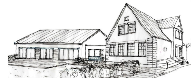
Impression von der Dorfstrasse aus