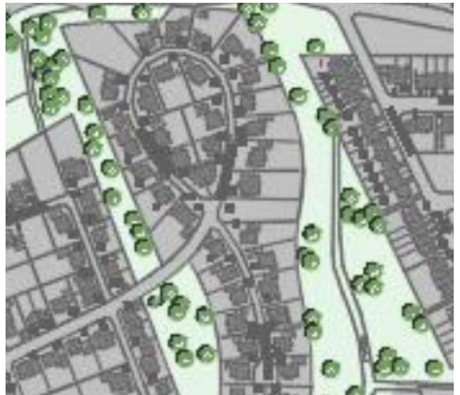
Ausschnitt Pahlhügel mit möglicher Bepflanzung

Als weiteren Schwerpunkt werden wir ein Programm auflegen welches das Pflanzen von Bäumen in den einzelnen Ortsteilen vorsieht. Hierüber wird zeitnah weiter berichtet.